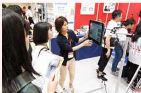
ICT支援機器のデモンストレーション