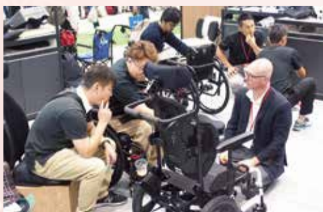
海外製の車いすも幅広く展示