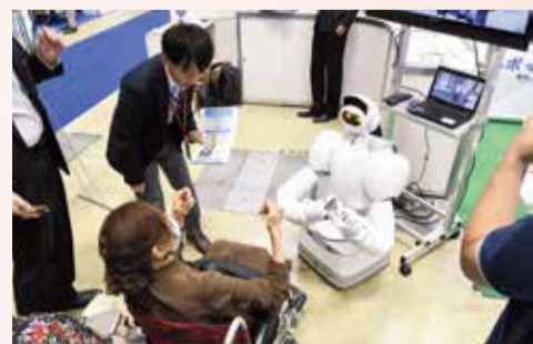
AIによる見守り機能を備えたロボット等を展示