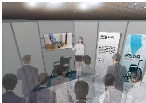
ガイドツアーのイメージ